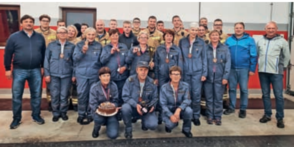
Starejše gasilke PGD Dobračeva z bronastimi medaljami z državnega prvenstva v Gornji Radgoni

Dobračeva pa so bili skupno drugi. PGD Račeva je bilo v skupnem seštevku za prehodni pokal mladine na tretjem mestu. Dobri rezultati na tekmovanjih so kazalnik pripravljenosti in požrtvovalnosti gasilcev, delo v praksi pa je povsem nekaj drugega. Taka znanja in spretnosti gasilci najlažje pridobijo na praktičnih vajah. V začetku oktobra so se preizkusili v reševanju zaposlenih in stanovalcev doma starejših občanov Senecura. Podoben preizkus so opravili v podjetju Mapro v industrijski coni v Žireh. Vaja je potekala v delu skladišča, montaže in lakirnice, kjer je možnost požara največja. Pri obeh akcijah so sodelovala vsa štiri gasilska društva Gasilskega poveljstva Žiri. Prav tako so oktobra, v mesecu požarne varnosti, pripravila dan odprtih vrat. Pregledovali so gasilne aparate in izvajali druge aktivnosti za ozaveščanje občanov in učinkovitejšo pomoč pri nesrečah in drugih nevarnih stanjih. Delovno je bilo tudi 21. oktobra, ko so gasilci PGD Dobračeva organizirali tehničnoreševalni dan. Udeležilo se ga je 35 tečajnikov iz domačega in okoliških društev. Člani so pridobivali nova znanja in izmenjavali izkušnje na petih različnih točkah. Urili so se v reševanju iz ruševin in globine ter nudenju prve pomoči ob dveh prometnih in množični nesreči.