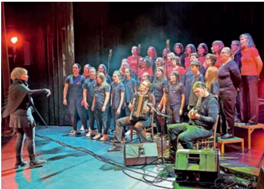
V Žireh so sredi oktobra praznovali dan spomina ob osemdeseti obletnici umika okupatorja iz Žirov.

Župan je v svojem nagovoru še poudaril, da je bila druga svetovna vojna prva vojna, v kateri so se Slovenci borili za svojo zemljo, obstanek in boljši jutri. »V prvi svetovni vojni so se namreč Slovenci borili za tuje gospodarje.« Župan je v svojem nagovoru še poudaril, da si rojeni po drugi svetovni vojni težko predstavljamo, kaj pomeni vojna ter koliko strahu, po-