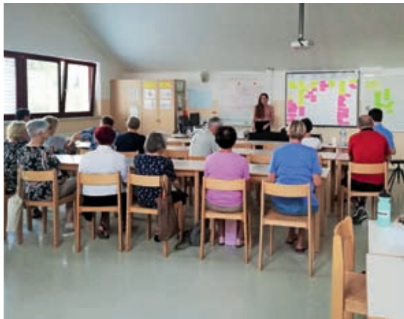
Delavnica v Žireh

dili analizo stanja, jo dopolnili s strokovnimi smernicami, kar je bila osnova za pripravo študije, ki bo priloga strategiji. Iz ugotovitev v študiji smo oblikovali strateške cilje, ki nakazujejo smer razvoja občine v dolgoročnem načrtovanju, ter podcilje, ki bolj neposredno ustrezajo potrebam iz analize. Čez celotni proces so se izluščile že nekatere rešitve, ki smo jih na zadnji delavnici