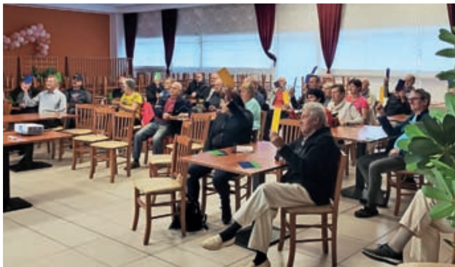
Predavanje o cestnoprometnih predpisih v Žireh

Ob zaključku predavanja pa se je deset starejših voznikov, imetnikov voziškega izpita kategorije B, lahko prijavilo na brezplačni tečaj v Centru varne vožnje na Vranskem. To možnost je izkoristilo devet prisotnih, ki so se teden kasneje s svojimi vozili odpravili na Vransko. V štiriurnem programu Senior so obnovili teoretična in praktična znanja, spoznali elemente varne vožnje in se preizkusili