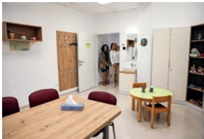
Najemnino za nove prostore Centra za duševno zdravje otrok in mladostnikov ter Razvojne ambulante s centrom za zgodnjo obravnavo sofinancira tudi Občina Žiri.

V škofjeloški Razvojni ambulanti s centrom za zgodnjo obravnavo, ki deluje v okviru Zdravstvenega doma Kranj, preverjajo kakovost otrokovega razvoja, odkrivajo odstopanja od običajnega razvoja ter otrokom in njihovim družinam nudijo timsko usklajeno podporo