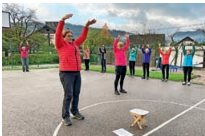
Vadba 1000 gibov po novem poteka tudi v Žireh.