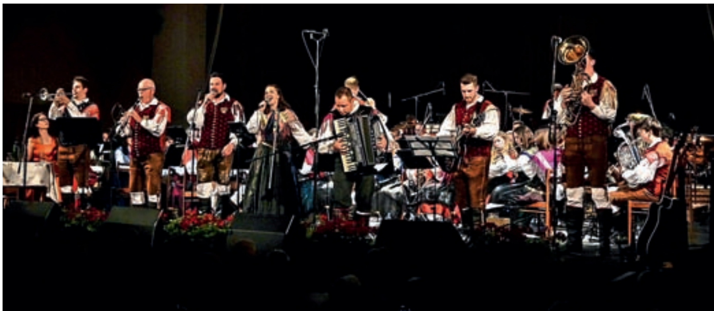
Utrinek z letnega koncerta