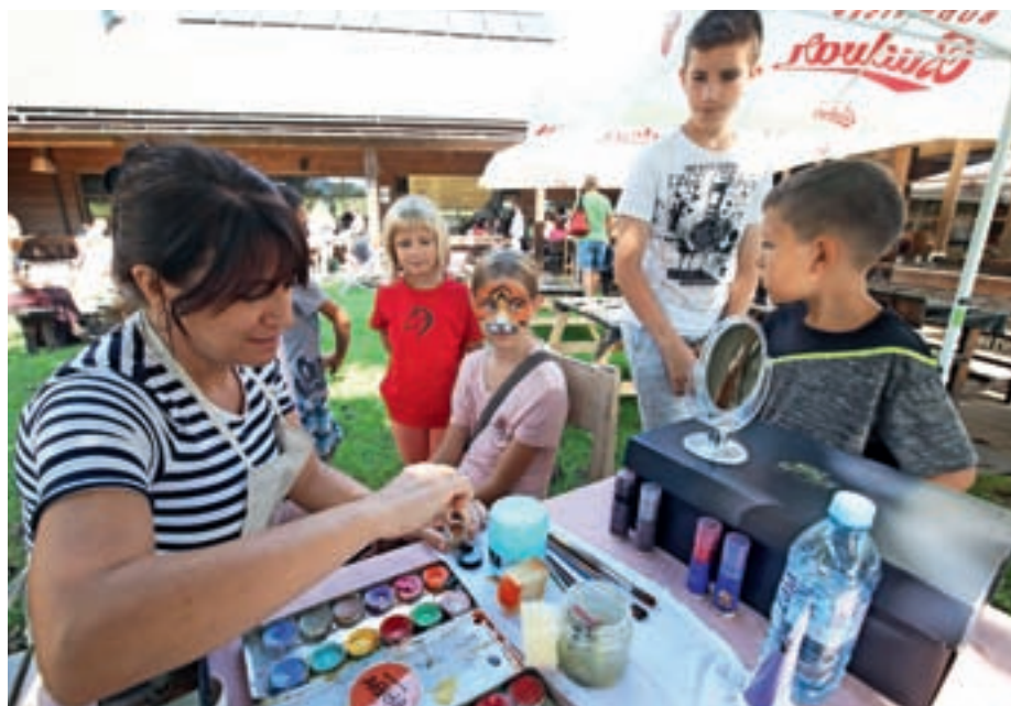
Srečanje rejniških družin v Besnici

Center za socialno delo Gorenjska se zahvaljuje vsem, ki so kakor koli prispevali k izvedbi srečanja. Želijo si, da bi Srečanje rejniških družin postalo tradicionalno.