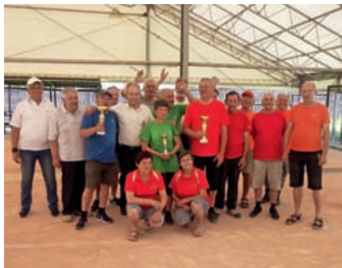
Turnir v balinanju v Žireh