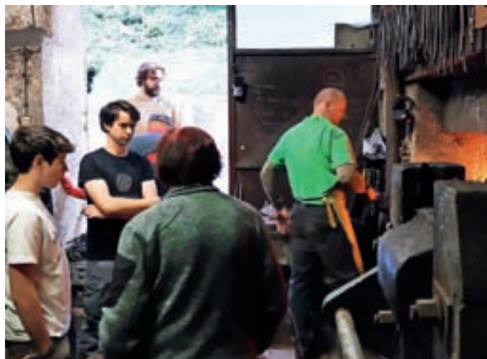
Kovaški mojster pri delu

njem. Ogled so zaključili s kovanjem žebeljev in zidarskih spon oziroma »klamf«, pri katerih so se v kovanju lahko preizkusili tudi obiskovalci.