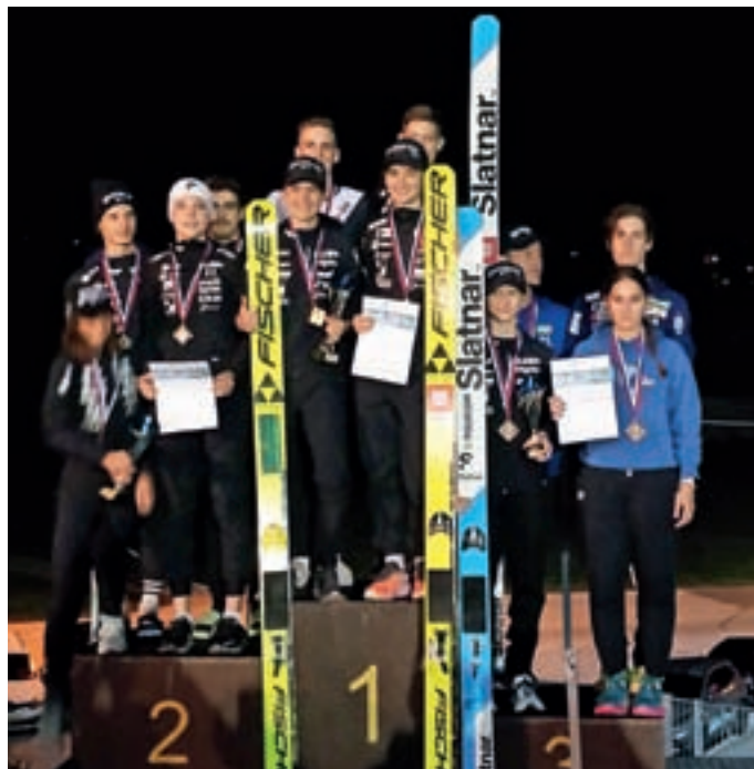
Zmaga ekipe SSK Norica Žiri na članskem državnem prvenstvu v Kranju

V Nordijskem centru Poclain je september minil precej delavno in smo presegli 1000. delovno uro zaradi avgustovskih poplav.