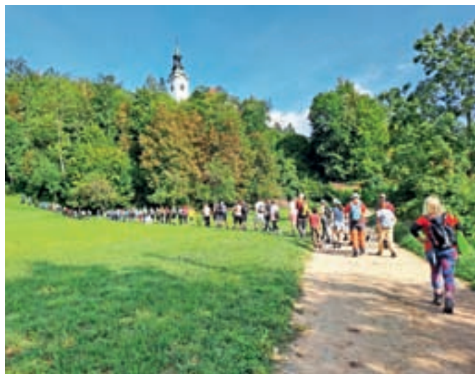
Na pohod ob nekdanji rapalski meji se je letos odpravilo več kot 130 pohodnikov.