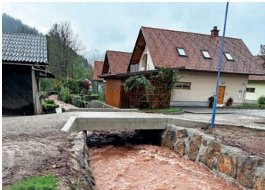
Novi most pri Primcu

Ta čas je tako kar nekaj cest, in sicer v skupni dolžini kilometer in pol, pripravljenih za asfaltiranje – zgrajeni so oporni