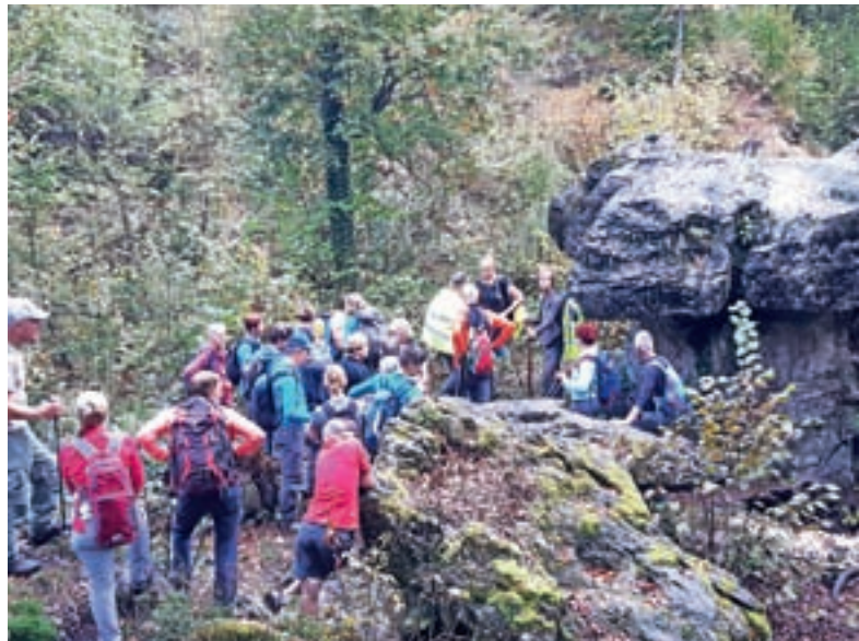
Postanek pohodnikov pri kamniti mizi v Ravnah