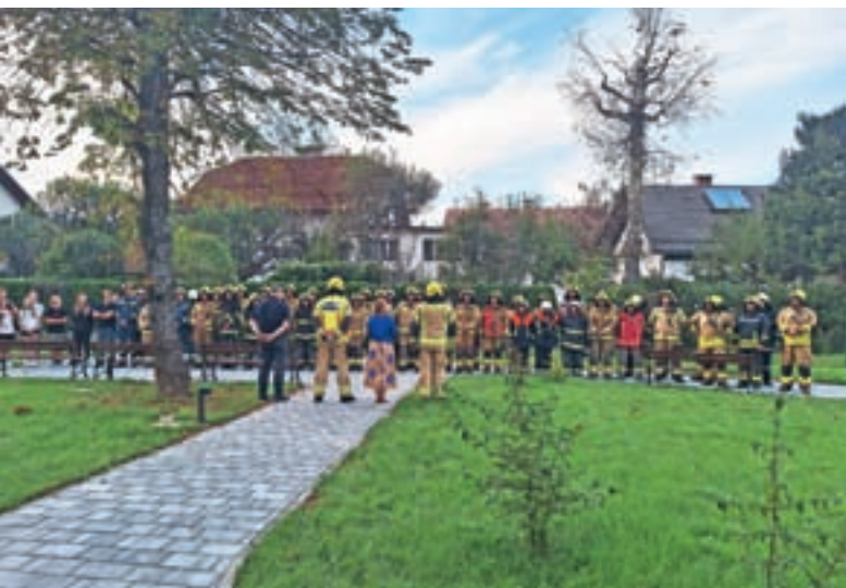
Pri organizaciji vaje smo se povezali z lokalnimi gasilskimi društvi.

poškodb ujeti v objektu. Vlogo ujetih v požaru so uspešno odigrali člani podmladka gasilskih društev. Izvedeni so bili notranji napadi po glavnem stopnišču in po požarnih stopniščih, v akciji so rešili osebe, ki so ostale ujele na balkonu, pogasili požar ter na koncu prezračili in pregledali celotno nadstropje. Vodenje vaje se je izvajalo prek poveljniškega mesta v vozilu PGD Dobračeva. Zaradi velikosti objekta pa je bilo delovišče razdeljeno na dva ločena sektorja, v vsakem od sektorjev sta delovali dve gasilski enoti.