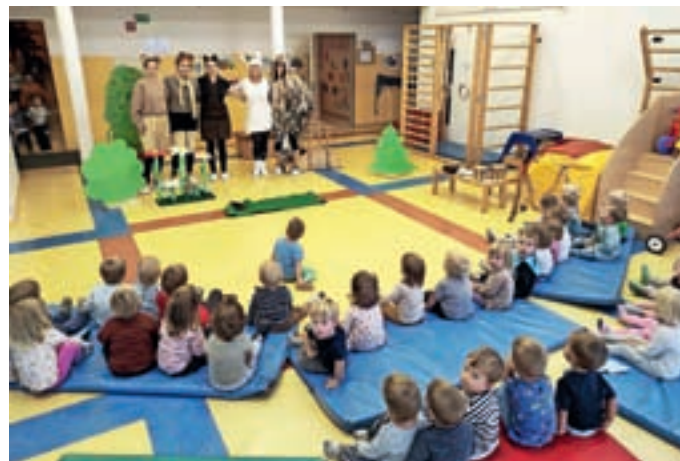
Vzgojiteljice so malčke v jaslih razveselile z igrico Zrcalce.