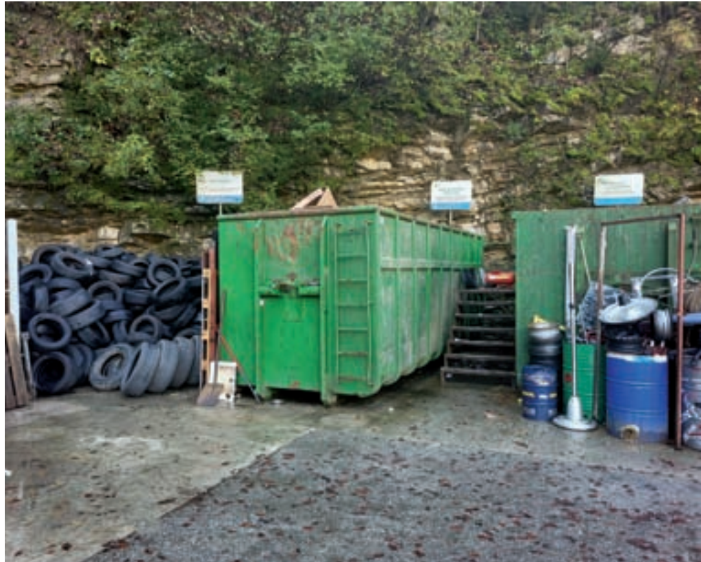
Občani lahko oddajo omejeno število pnevmatik.

V marcu je Občina Žiri naročila sortirno analizo mešanih komunalnih odpadkov. Analizo je izvedel Nacionalni laboratorij za zdravje, okolje in hrano, enota Novo mesto. Po mnenju izdelovalcev analize smo glede ločevanja odpadkov nekje v državnem povprečju. Analiza ne izkazuje