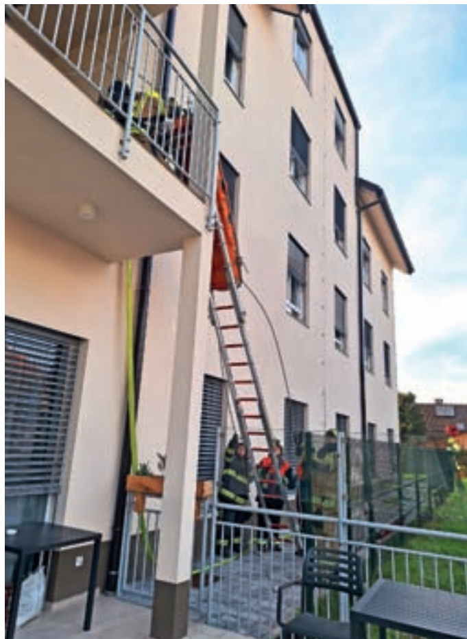
Gasilska vaja v Domu starejših občanov SeneCura Žiri

Hkrati s požarnim alarmom so bile v skladu z načrtom alarmiranja aktivirane tudi vse gasilske enote v občini Žiri. Ob prihodu na kraj so gasilske enote pomagale pri evakuaciji stanovalcev, nato pa z notranjimi napadi v samo mansardo objekta rešile še 12 ponesrečencev, ki so bili zaradi dima in različnih